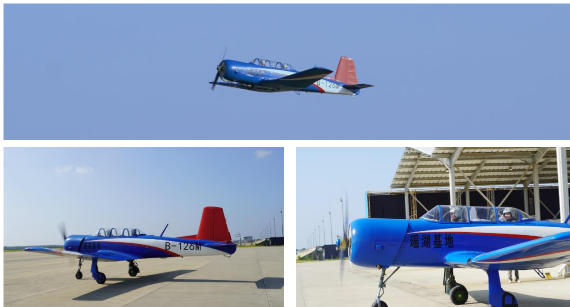
组图 2：“雏鹰”试翼，民用 CJ6 初级教练机试航瑶湖机场

报告期内，公司成功组织或配合完成了国家和省、市多项重大活动，全力配合保障“2023 中国航空产业大会暨南昌飞行大会”顺利举行，南昌飞行大会保障案例入选航空工业大安全管理成果。