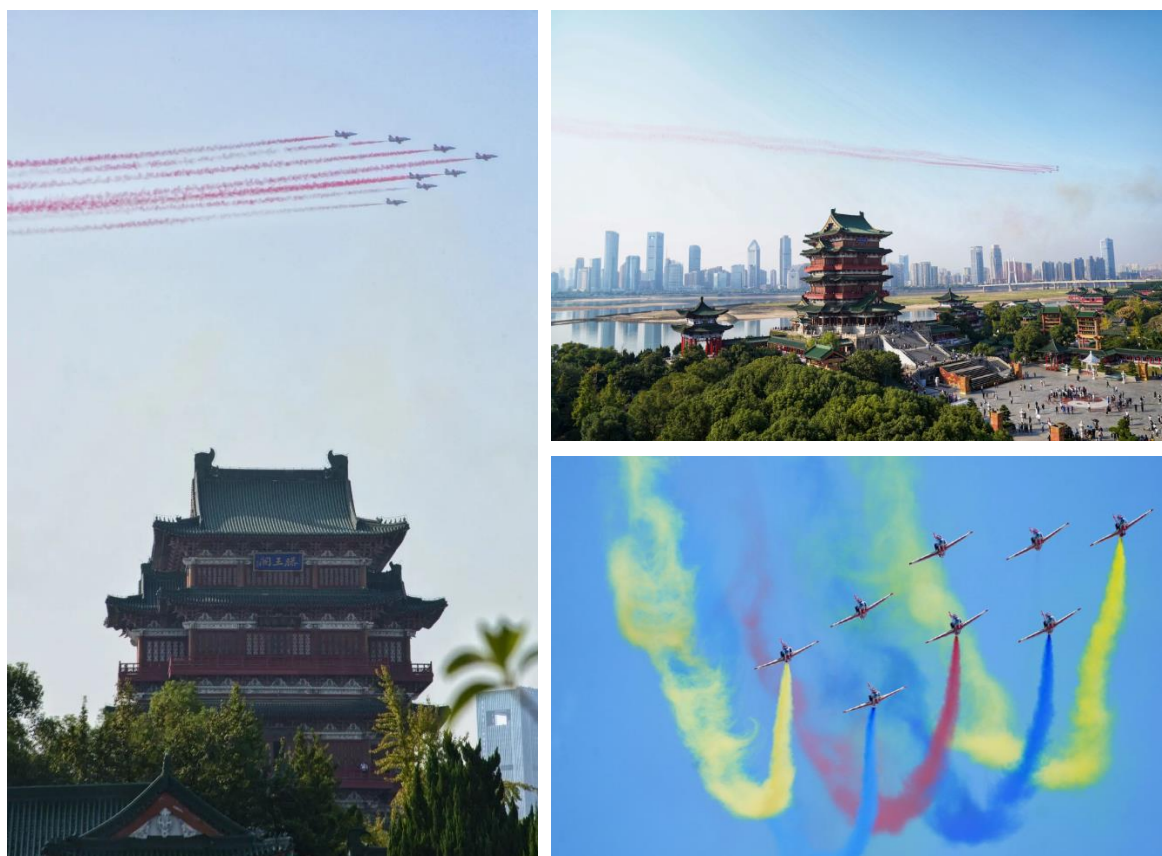
组图 3：“红鹰”献艺，K8 基础教练机飞跃滕王阁，献礼“南昌飞行大会”

报告期内，公司成功组织或配合完成了国家和省、市多项重大活动，全力配合保障“2023 中国航空产业大会暨南昌飞行大会”顺利举行，南昌飞行大会保障案例入选航空工业大安全管理成果。