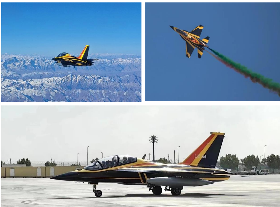
组图 1：“猎鹰”亮翅，L15 高级教练机新涂色亮相迪拜国际航展

报告期内，国际市场开拓取得积极进展，L15 高教机亮相迪拜国际航展，以其为代表的公司产品系列引起参展用户的广泛、深度关注和积极对接，公司作为中国教练机基地的品牌效应和国际知名度大幅提升。